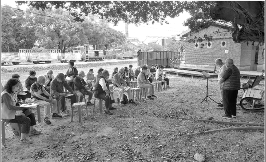
松年團契夕陽禮拜