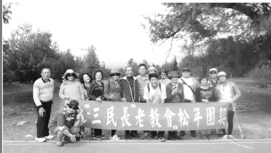
松年團契台東靈修旅遊