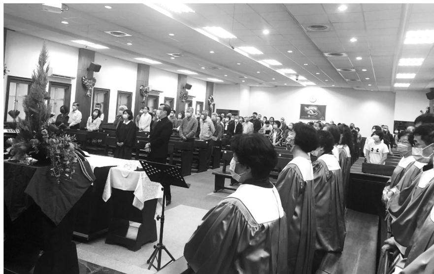
感恩節獻上「手抄聖經」