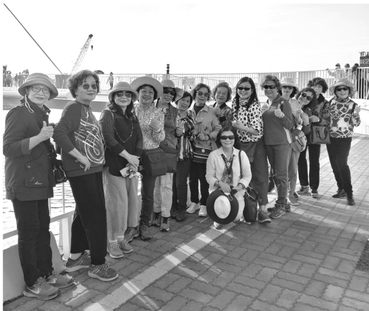
婦女團契駁二半日遊