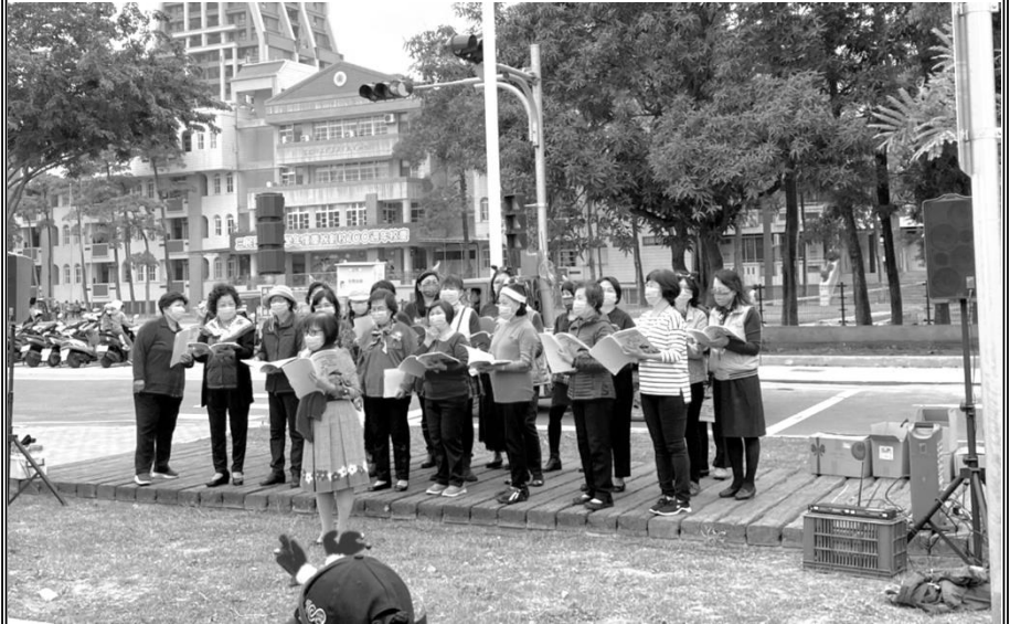
聖誕節社區福音活動