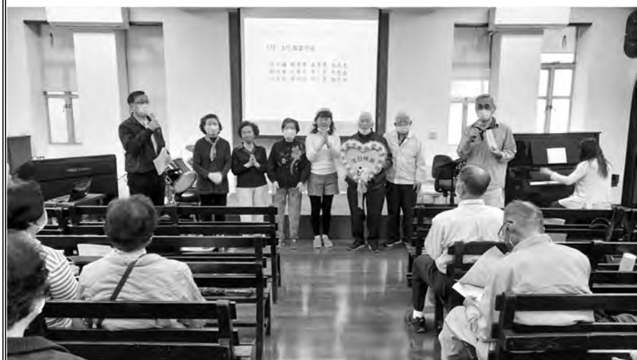
松年團契月例會&慶生會